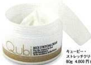
キュービー・ ストレッチクリーム 80g 4,800円(税別)

美しく年齢を重ねるために大切なこと。 それは、うるおいに満ちた肌のエイジングケア。 特に年齢がでやすい首周りは キュービー・ストレッチクリームで集中ケア。 つや・ハリ・弾力が実感できる肌に整えます。